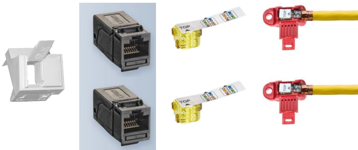
Rys.1. Wkład Punktu Logicznego

Układ Punktu Logicznego pokazano na poniższym rysunku poglądowym. W zależności od konfiguracji punktu należy doprowadzić jeden lub dwa kable transmisyjne. W przypadku PEL-a składającego się z jednego modułu, należy użyć ramki jednokrotnej.